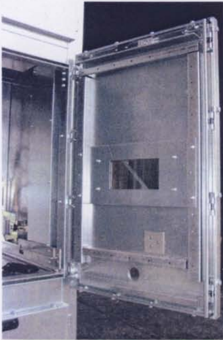
Bild 2. Die Vielfach-Verrastung der Türen sorgt für eine hohe Druckfestigkeit im Störlichtbogenfall

die Schaltfelder modular, luftisoliert und montagefreundlich zu konzipieren. Dabei wird die Prüfung auf Störlichtbogenfestigkeit immer wichtiger und gehört heute zu den anerkannten Qualitätsmerkmalen. Lisa und Malu erfüllen diese Anforderungen und sind durch das luftisolierte Grundkonzept eine umweltfreundliche Alternative für die Zukunft.