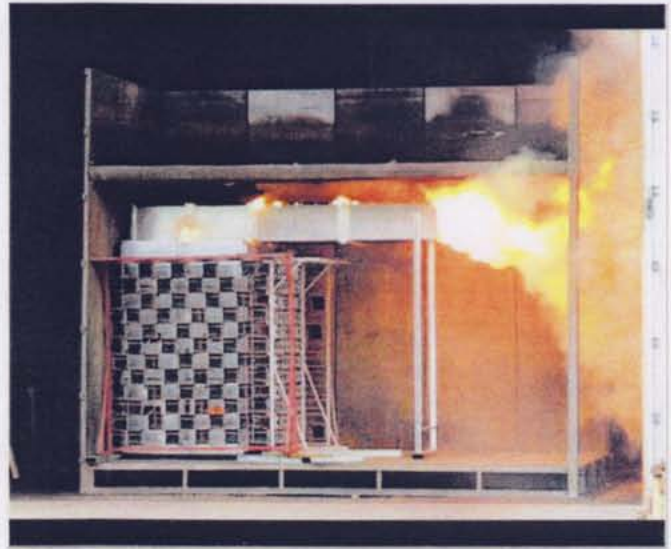
Bild 3. Prüfung der Schaltfelder mit Druckentlastungskanal oben