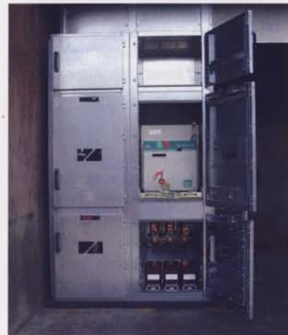
Abb. 5. Prüfaufbau der Schaltfelder mit Druckentlastungskanal oben. Die geöffneten Türen zeigen den Innenausbau

Nicht zuletzt unter Berücksichtigung des großen Exportmarkts für Mittelspannungs-Schaltanlagen ist es vorteilhaft, die Schaltfelder modular, luftisoliert und montagefreundlich zu konzipieren. Dabei wird die Prüfung auf Störtlichtbogenfestigkeit immer wichtiger und gehört heute zu