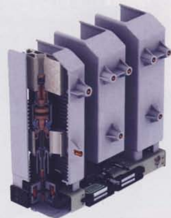
Abb. 3. Technischer Aufbau des Vakuum-Leistungsschalters Typ ISM von Tavrida Electric AG

Systeme GmbH eine neue Schaltfeldkonstruktion nach der klassischen Bauart entwickelt. Hierbei wurden die Erfahrungen und Erkenntnisse im Umgang mit den vorhandenen Betriebsmitteln (Vakuum-Leistungsschalter, siehe Tab. 1) integriert, die neuen Bestimmungen IEC 62271-200/VDE 0671 Teil 200 (2004) umgesetzt und auch die Störlichtbogenprüfungen nach der neuen IAC (Internal Arc Classified) (IEC 62271-200, 2004) durchgeführt.