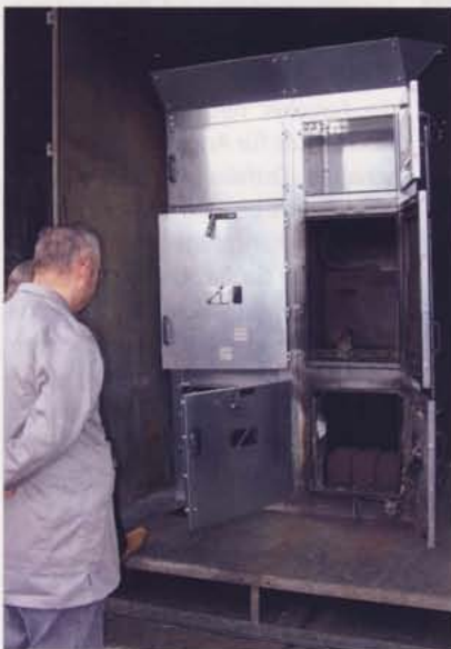
Abb. 6. Begutachtung der Schaltfelder (Abb. 4) nach bestandener Prüfung

Eine wichtige Entscheidungsgrundlage für den Anwender ist die Störtlichtbogenprüfung. Daher haben Tavrída Electric AG und