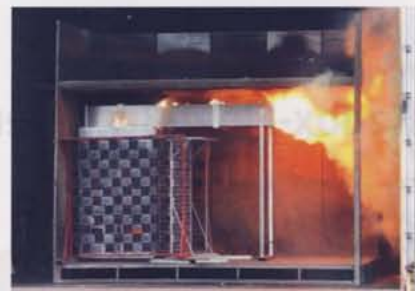
Abb. 7. Prüfvorgang der Schaltfelder mit Druckentlastungskanal oben (Abb. 5)

den weltweit anerkannten Qualitätsmerkmalen. LiSA/MALu erfüllen diese Anforderungen vollständig und sind durch das luftisolierte Grundkonzept eine umweltfreundliche Alternative der Zukunft.