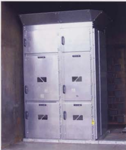
Abb. 4. Prüfaufbau der Schaltfelder mit schrägen Ableitblechen oben

sowie des Schnellerders. Jeder Betriebsraum ist mit einer separaten Tür versehen, die über eine leicht zu bedienende Vielfach-Verrastung mit dem Schaltfeld druckfest verschlossen wird (Abb. 2) und auch störtlichtbogenfest ist. Mit einer Feldbreite von nur 650 mm (bis 1.250 A) oder 800 mm (bis 2.000 A) und einer Felddiefe von nur 1.200 mm, ist die Schaltanlage sehr kompakt und erfüllt somit eine wichtige Anforderung seitens der Anwender.