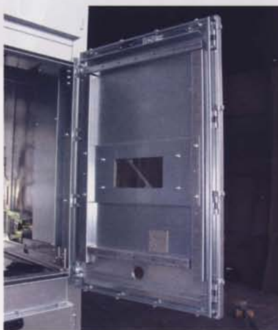
Abb. 2. Vielfach-Verrastung der Türen für eine hohe Druckfestigkeit im Störlichtbogenfall

Abbildung 1 zeigt beispielhaft den technischen Aufbau des Schaltfeldes mit oben liegender Sammelschiene, herausziehbarem Vakuum-Leistungsschalter, Anordnung der Strom- und Spannungswandler